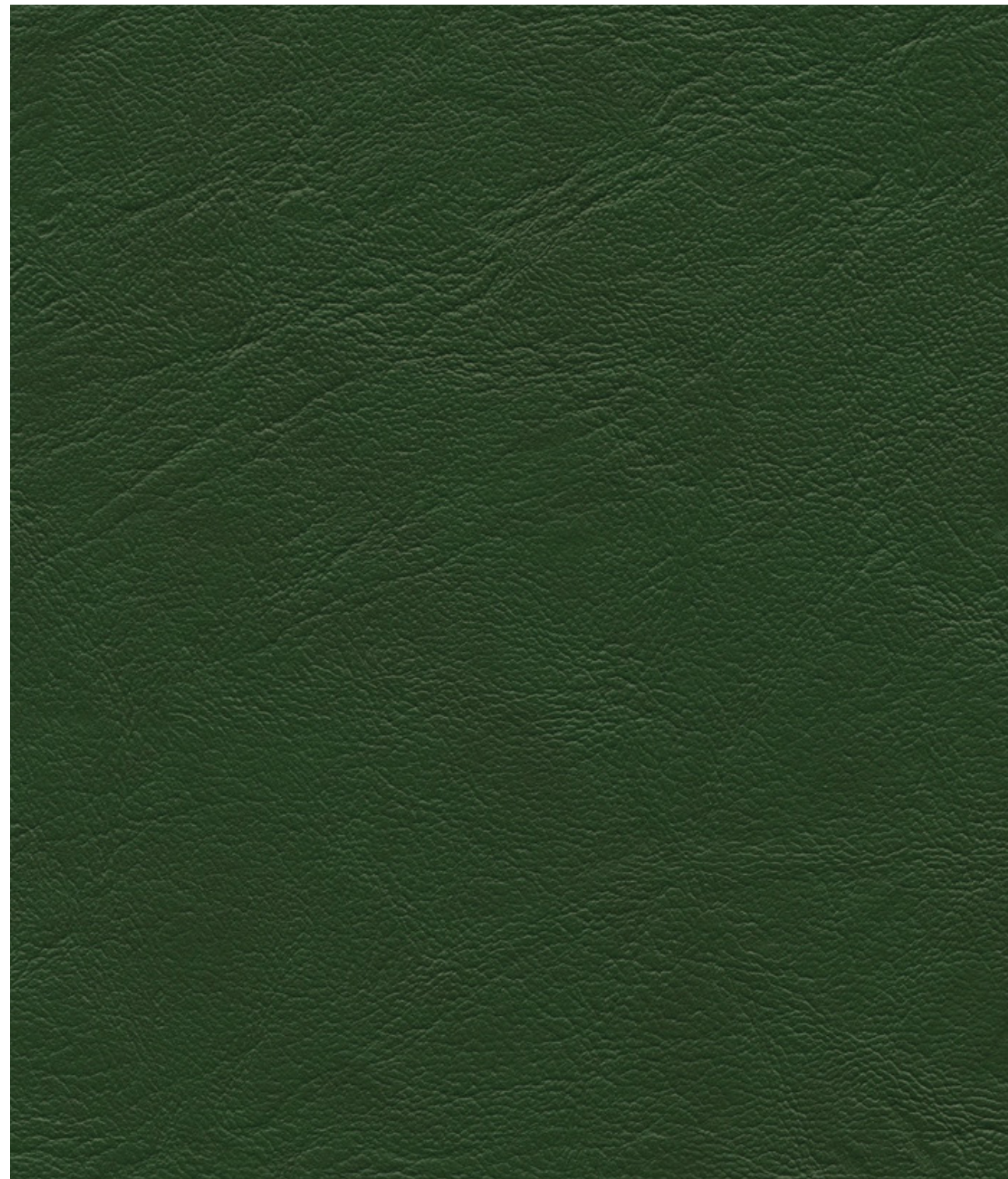
skai® Gavino green

Material de tapizado de alta calidad con grano de cuero clásico. Gracias a su relieve natural, el material ofrece las sensaciones del cuero auténtico. Su estampado único aporta vitalidad a este material. Gracias a su paleta de colores diversa y sus propiedades retardantes de la llama, skai® Gavino es ideal para su uso en el sector hostelero.