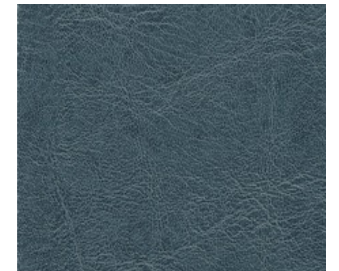
sea blue F6411232